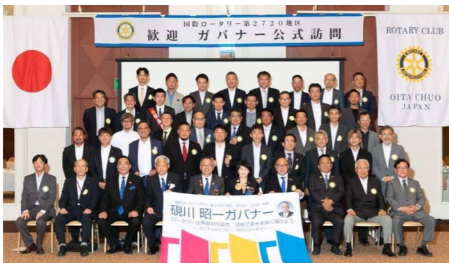
大分第4グループのガバナー公式訪問にて