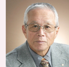
遠山 宇宙 八代 RC (第7回)