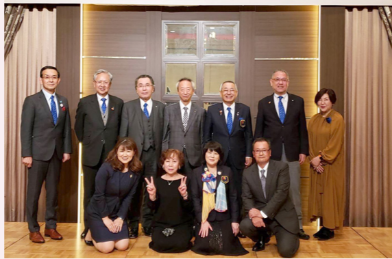
大森克磨ガバナーエレクト国際協議会壮行会風景