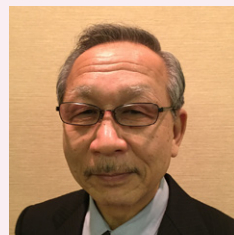
林 明 熊本江南 RC (第1回)