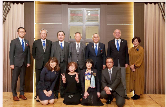
大森克磨ガバナーエレクト国際協議会壮行会風景