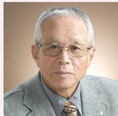
遠山 宇宙 八代 RC (第7回)