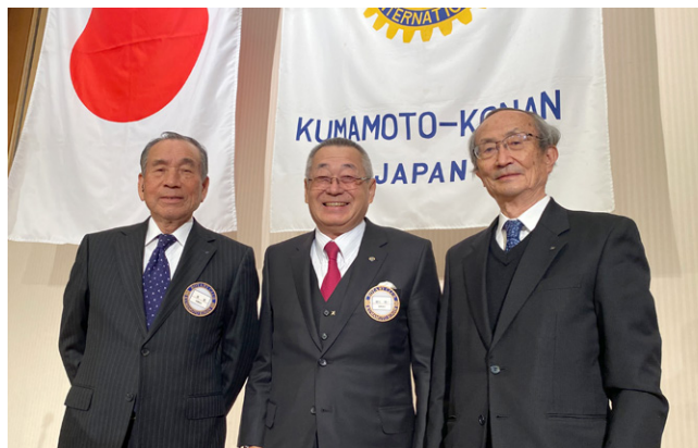
コロナ過の中、年始の我が熊本江南ロータリークラブ例会にて 寸前にマスク外しています。