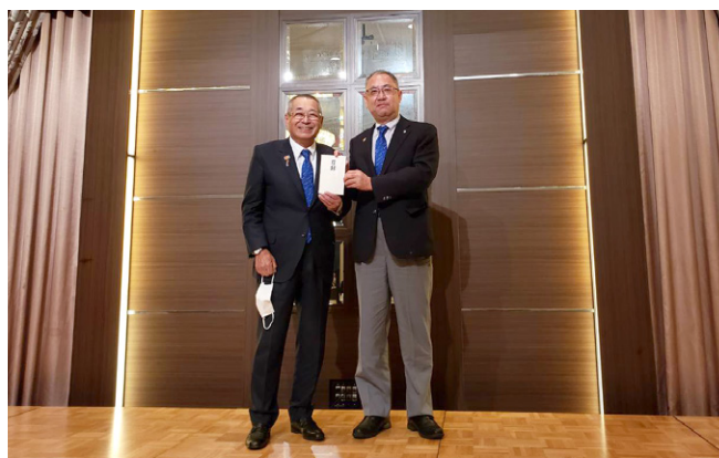
初のオンライン国際協議会、大森ガバナーエレクトご健闘お祈りします。