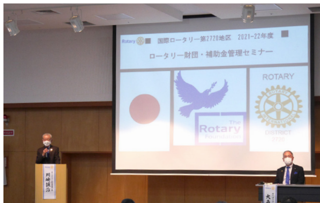
R財団補助金管理セミナー (大分会場) 広い会場でコロナ対策した、久々のリアルセミナーです。